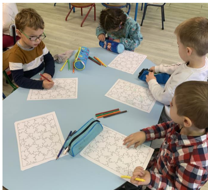
Nous apprenons aussi à tracer des lignes dans les deux sens.